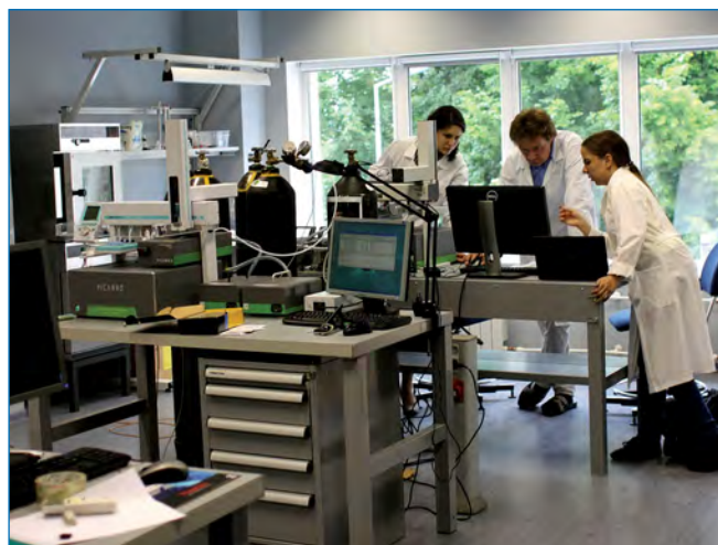
Изотопные исследования керна древнего льда со станции Восток в ЛИКОС ААНИИ

программы поможет лучше понять генезис МРТ, а также внесет существенный вклад в разработку новых методов датирования и исследования кернов древнего антарктического льда еще до старта крупного международного проекта глубокого бурения в районе Купола С.