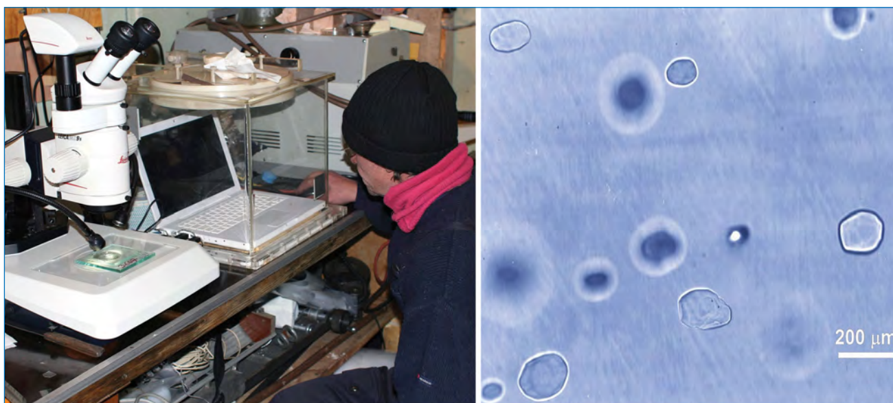
Микроскопические исследования кристаллических включений гидратов воздуха в шлифах древнего льда в холодной гляциологической лаборатории станции Восток

лет. Совсем недавно эта «гидратная» датировка «восточного» керна была подтверждена результатами абсолютного датирования, сделанного по содержанию космогенного изотопа криптон-81 в экстрагированном из льда атмосферном воздухе (материал готовится к публикации). Таким образом, теперь есть все основания утверждать, что имеющийся в распоряжении российских исследователей ледяной керн со станции Восток является на сегодняшний день самым древним и, более того, единственным полученным в Восточной Антарктиде керном, возраст льда в котором превышает 1 млн лет.