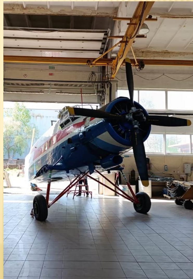
Подготовка фюзеляжа самолета к монтажу