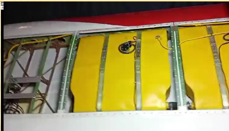
Крыло самолета с топливными баками