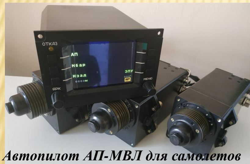
Автопилот АП-МВЛ для самолетов малой авиации разработки АО «КБПА»