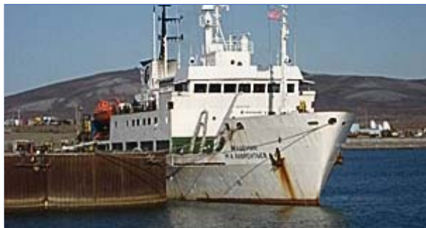
Рис. 1. НИС «Академик М.А.Лаврентьев»

Для подъема двух ПБС, не всплывших из-за обрастания размыкателей после подачи им команды по гидроакустическому каналу связи, пришлось применить траление с кормы с использованием специального устройства (рис. 3).