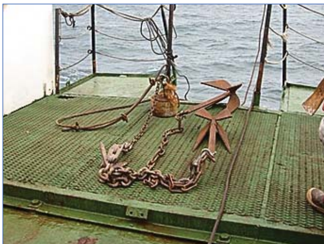
Рис. 4. Устройство для траления

На шести поставленных в 2007 г. ПБС были установлены системы ISCAT для измерений на глубине около 15 м температуры, электрической проводимости и гидростатического давления. Системы состоят из измерителя SBE 37 IM MicroCAT, индуктивного соединительного устройства SBE Inductive Cable Coupler и записывающего устройства ISCAT