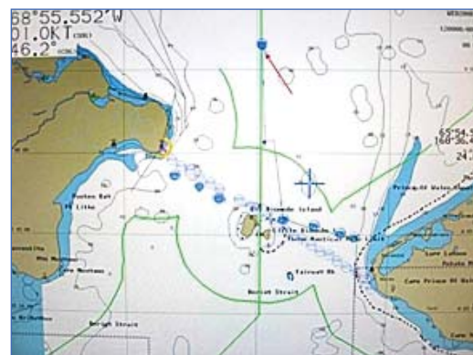
Рис. 2. Маршрут судна и точки постановки ПБС в экспедиции «Русалка-2008»