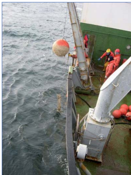
Рис. 3. Подъем ПБС А1-3-07

Подъем ПБС с помощью устройства для траления производился следующим образом. Судно описывало циркуляцию вокруг точки постановки АБС, постепенно вытравливая за корму трос с прикрепленным устройством, затем ложилось в дрейф и выбирало трос. Если станция не всплывала, попытки продолжались. В обоих случаях с помощью траления ПБС были успешно подняты. Для станции А1-1-07 потребовалось три попытки, и в результате станция была поднята вместе с ее якорем. Для подъема ПБС А2W-07 с помощью траления потребовалось более 4 часов хождения судна различными курсами, при этом было вытравлено около 1500 метров троса. На рис. 4 приведена фотография планшета GPS-системы с маршрутом судна при тралении на этой станции.