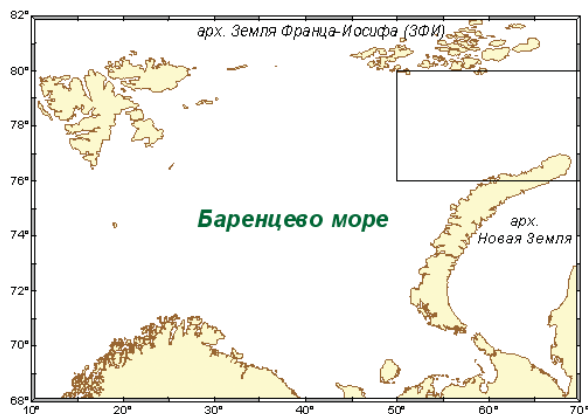
Рис. 1. Баренцево море и район исследований