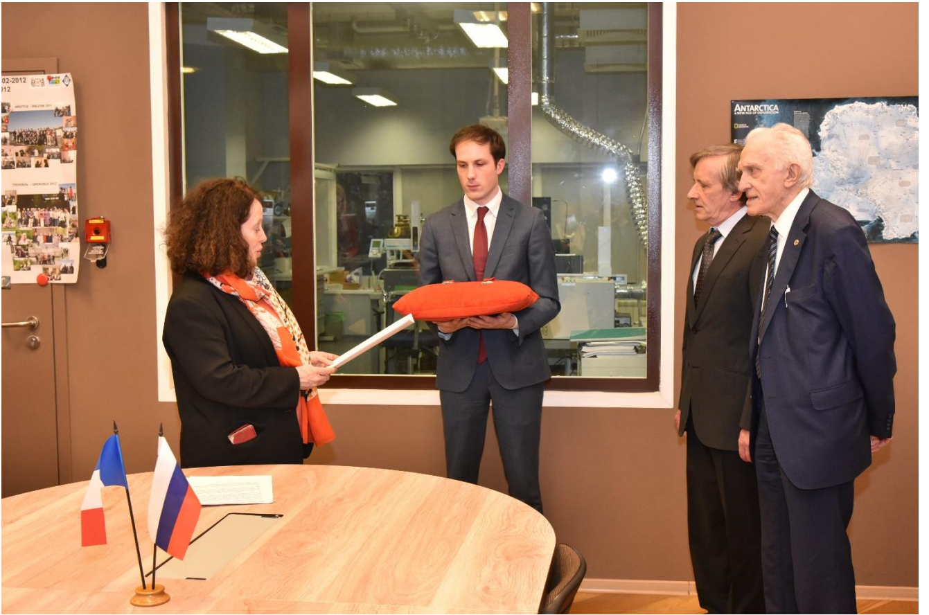
Церемония вручения Орденов Почетного Легиона